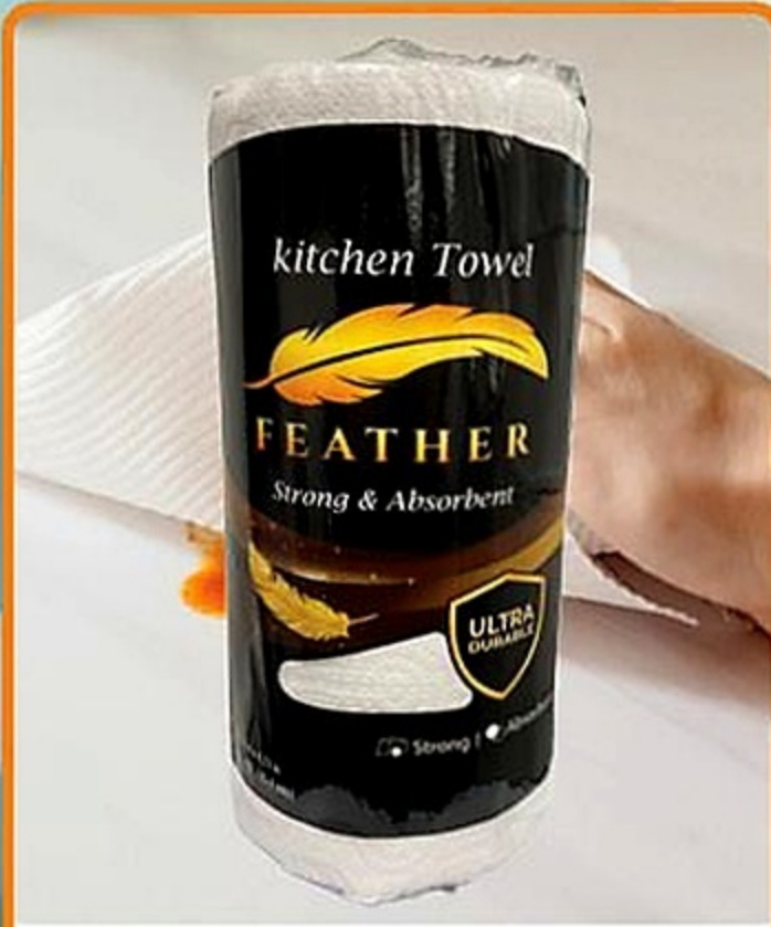
Feather Papel Toalla SAS 1 rollo Reg. 1.99