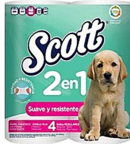
Scott 2en1 Papel Sanitario Pqte. de 4 rollos Reg. 2.69