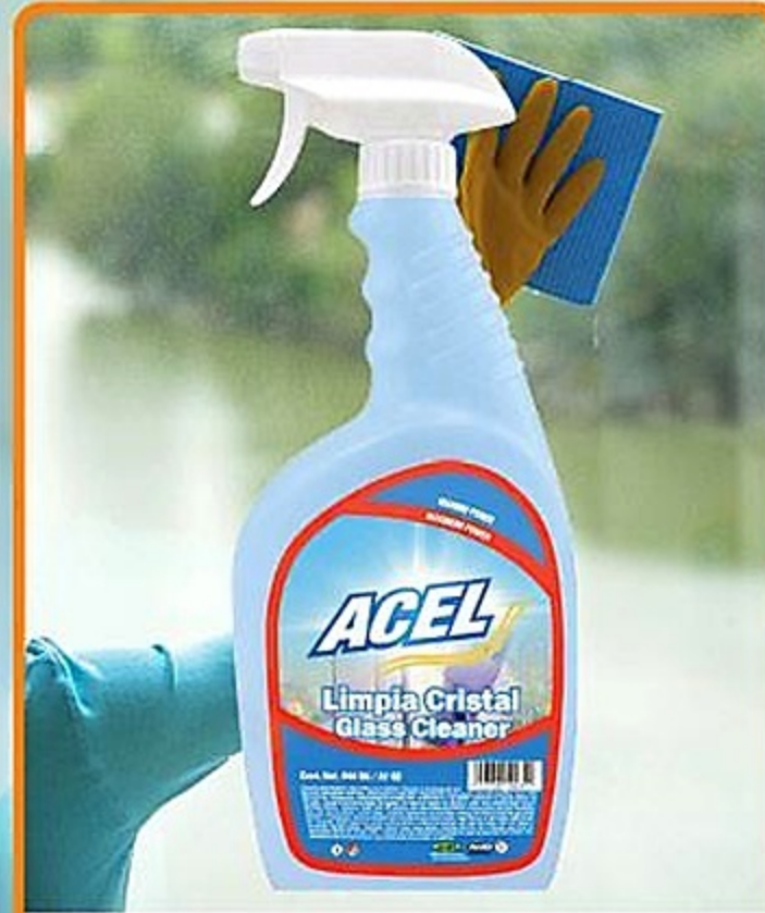
Acel Limpiador Cristal Spray Env. de 32 oz Reg. 1.99