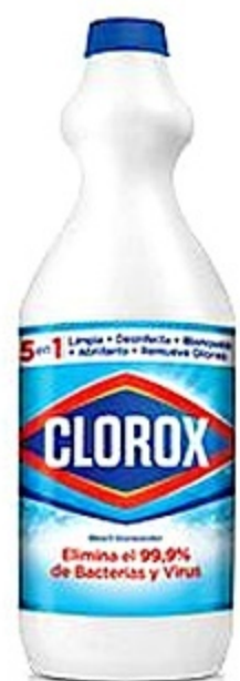
Clorox Original Bot. de 32 oz Reg. 1.79