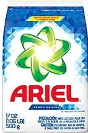
Ariel Regular Detergente Polvo Pqte. de 17 oz Reg. 2.29