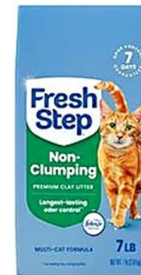
Fresh Step Original Arena Gato Fdo. de 7 lb Reg. 5.99