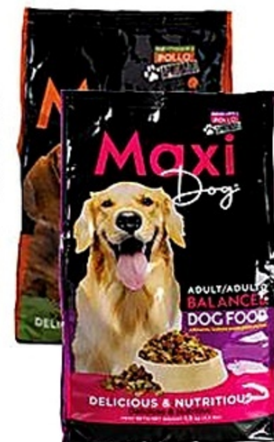
Maxi Dog Alimento Perro Variedad Fdo. de 3.3 lb Reg. 5.49