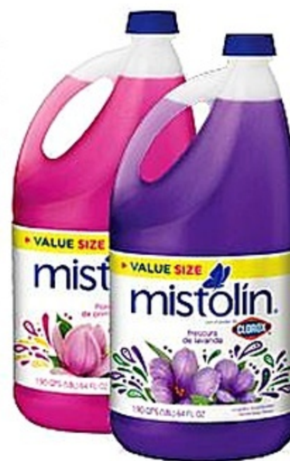
Mistolin Variedad Env. de 64 oz Reg. 2.89