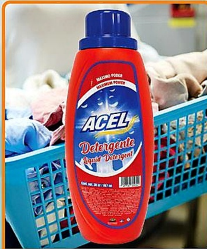
Acel Máximo Poder Detergente Líquido Env. de 30 oz Reg. 1.99