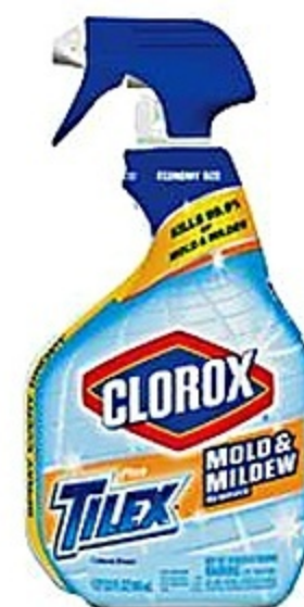
Clorox Plus Tblex Mold & Mildew Remover Env. de 32 oz Reg. 5.69