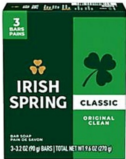
Irish Spring Original Jabón Pqte. de 3ct/3.2 oz Reg. 2.99