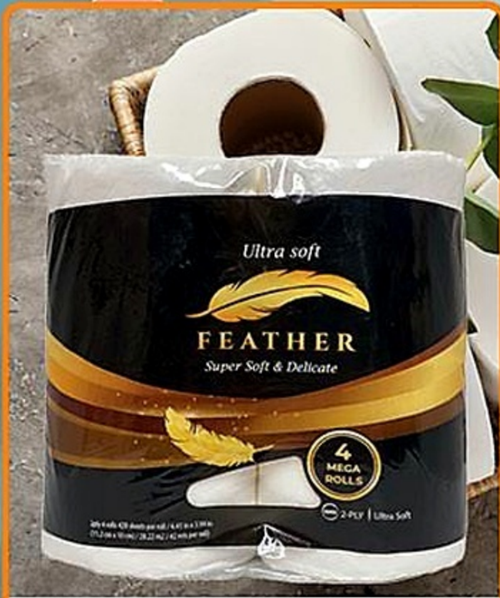
Feather Papel Sanitario Ultra Soft Pqte. de 4 rollos Reg. 3.59