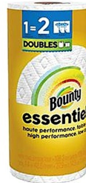
Bounty essentials Papel Toalla SAS Blanco (108h) 1 rollo Reg. 2.69