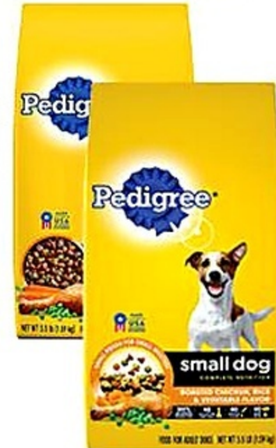
Pedigree Alimento Perro Variedad Fdo. de 3.5 lb Reg. 6.29