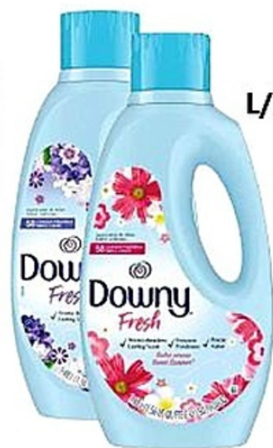
Downy S/Summer o L/Dream Lavander Suavizador Env. de 50 oz Reg. 4.59