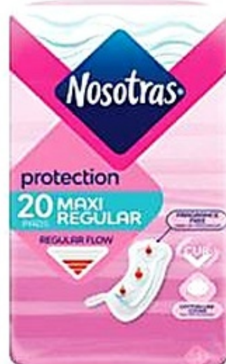
Nosotras Maxi Pads Pqte de 20 ct Reg. 2.99