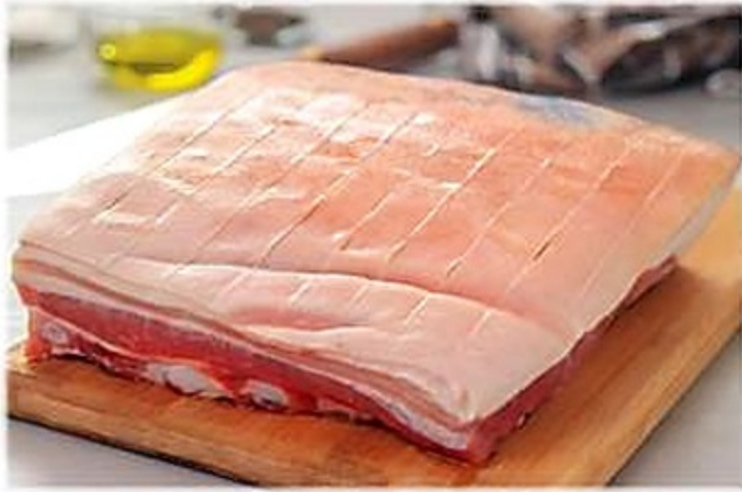
Pork Belly Cong. España Reg. 3.89 lb.