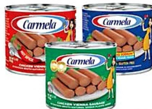
Carmela Salchichas de Pollo Variedad 5 Oz. Reg. 89¢ C/U