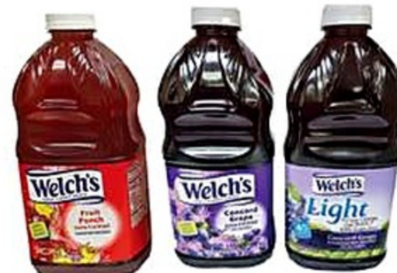
Welch's Cocktail Fruit Punch, Uva Concord o Uva Light 64 Oz. Reg. 3.99 C/U