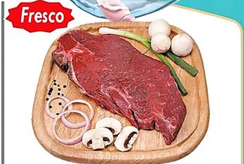
California Steak De Res Puerto Rico Reg. 4.99 lb.