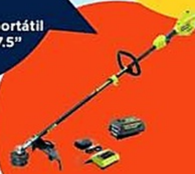
4 Trimmers Ryobic de 15"