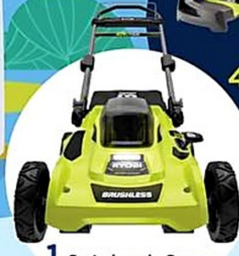
1 Cortadora de Grama Ryobic de 20"