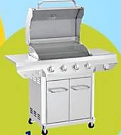
1 BBQ Nexgrill de Gas