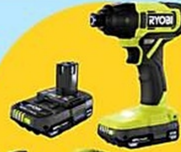
4 Destornillador Ryobic de 18 voltios