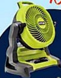
4 Abanicos portátil Ryobic de 7.5"