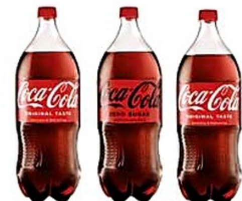
Coca Cola Original o Zero (No Incluye Dieta) 1.75 lt. Reg. 1.59 C/U