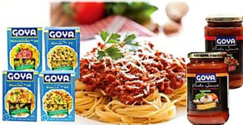
Goya Pasta Variedad Caja 16 Oz. Reg. 1.69-1.79 C/U