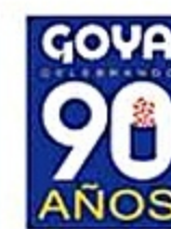
Goya Arroz Grano Mediano 3 lb. Reg. 2.39 C/U Especial 1.67 C/U