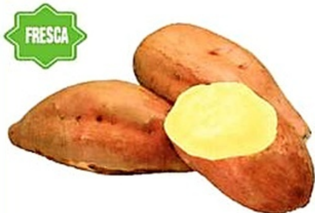
Batata Canol Republica Dominicana Reg. 1.49 lb.