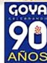
Goya Salsa para Pastas Variedad 12 Oz. Reg. 1.59 C/U Especial 1.33 C/U