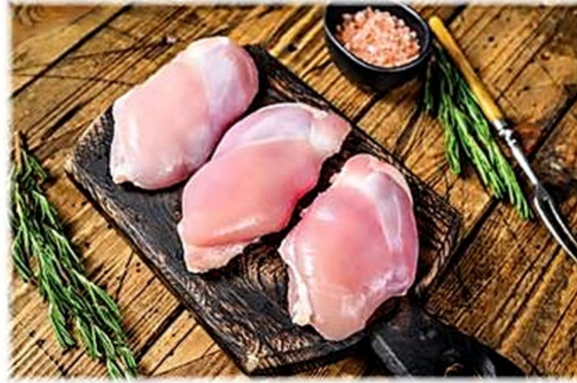
Caderas de Pollo Deshuesadas Cong. Estados Unidos Reg. 2.59 lb.